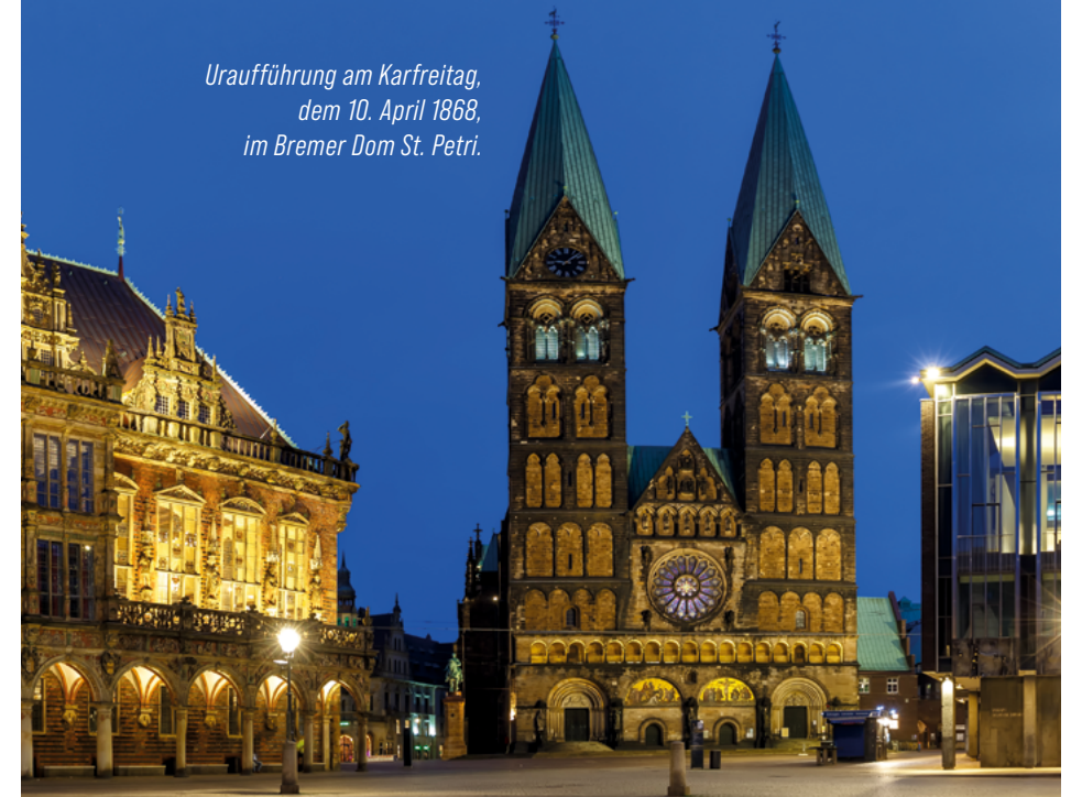
Uraufführung am Karfreitag, dem 10. April 1868, im Bremer Dom St. Petri.

Nach einer Vorab-Präsentation der ersten drei Sätze in der Wiener Hofburg fand die offizielle Uraufführung am Karfreitag, dem 10. April 1868, im Bremer Dom St. Petri statt. Geleitet vom 34-jährigen Brahms wurde sie ein triumphaler Erfolg. Das Werk bestand damals aus den genannten sechs Sätzen. Erst nach der Uraufführung komponierte Brahms einen siebten Satz hinzu. Es ist das an die fünfte Stelle platzierte Sopransolo mit Chor „Ihr habt nun Traurigkeit“. Der nachträgliche Einbezug hatte nicht nur künstlerische Gründe: Als Hinweis auf den Erlösertod Jesu wurde bei frühen